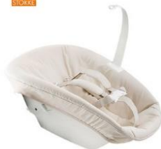
Tripp Trapp® Newborn Set™