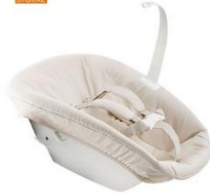
Tripp Trapp® Newborn Set™