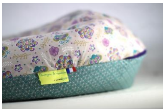
Table à langer

Quand le ventre se fait lourd on ne dort plus bien, avec le coussin que tu places sous le bidon, tu revis ! Pour avoir fait le tour il faut absolument un coussin marque les Babilleuses. Tu peux acheter les micro-billes pour le remplir par la suite, il est grand, il se déplie totalement, déhoussable, bref il te faut celui-là !